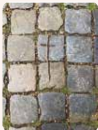
Zomaar op straat

Ergens las ik een toepasselijke quote: vrijwilligers, ze maken anderen én zichzelf gelukkiger: ik denk dat dat voor velen (inclusief mijzelf!) geldt.